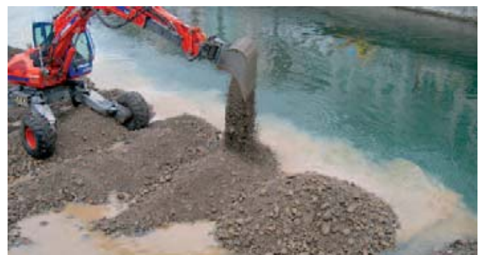
Schüttung der Baupiste