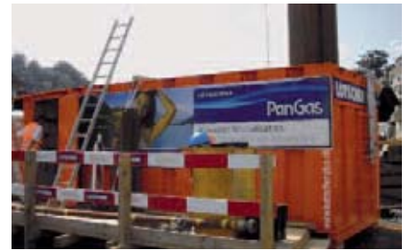
Automatische Neutralisationsanlage mit Kohlensäure