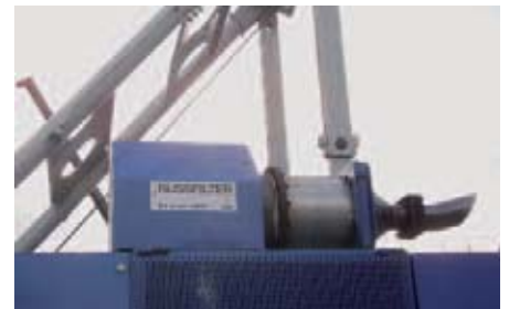
Russ-Partikelfilter einer Maschine