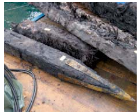
Eichenpfahl mit Pfahlschuh