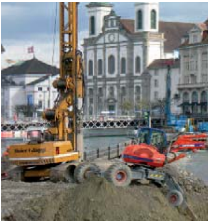
Lärmintensive Arbeiten am Reusswehr

pH-Wert Reuss. Damit Veränderungen des Wassers sofort festgestellt werden können, wird der pH (Mass für Säuregrad) oberhalb und unterhalb der Baustelle ständig überwacht.