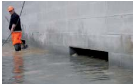
Neue Fischunterstände in der Trenninselmauer bei abgesenktem Wasserstand

Luftreinhaltung. Maschinen mit mehr als 18 kW Leistung müssen mit Russ-Partikelfiltern ausgerüstet sein und regelmässig gewartet werden. Letzteres gilt auch für alle übrigen Maschinen auf der Baustelle.